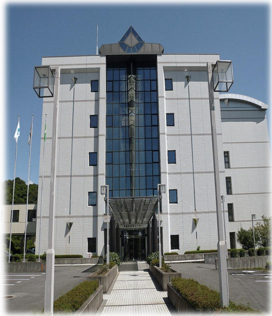
長崎県教育センター

県教育センターの指導主事を派遣し、研修講座で用いる資料を活用して、県内の学校や教育研究団体等での研修に対する支援を行います。